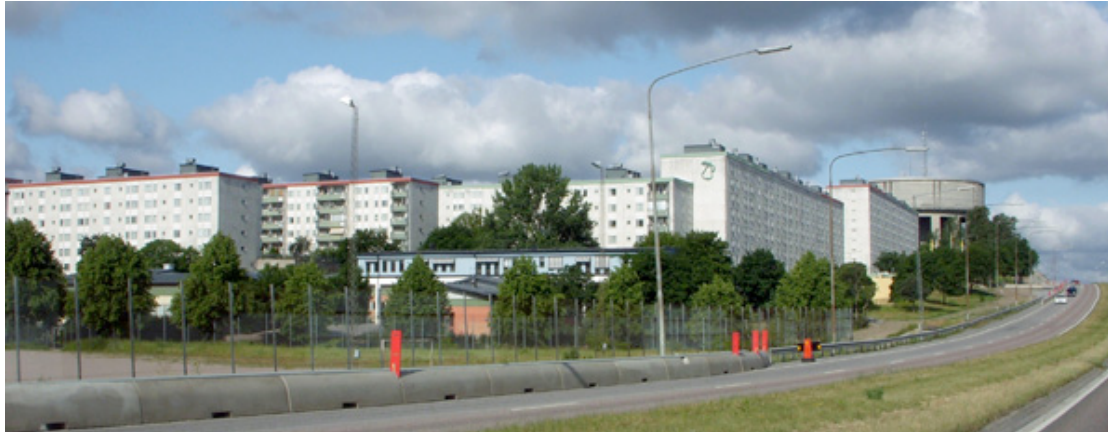
Edificios del Programa del Millón en Tensta, Estocolmo. 2

Estocolmo es hoy una ciudad segregada. El centro de la ciudad es rico y las áreas del “Programa del Millón” son pobres. La mayor parte de los cines, bares, clubes y lugares de trabajo quedan en el Centro, y como las personas más pobres de Estocolmo son las que viven en las áreas más distantes, son estas justamente las que más necesitan del metro para transportarse al trabajo, para visitar sus familias, para tener acceso a los lugares de diversión etc.