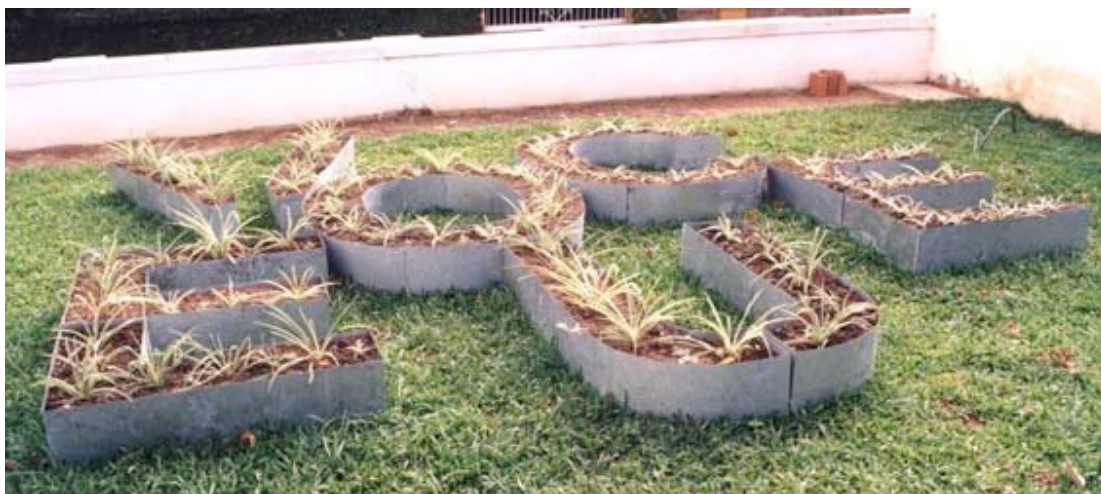
súperpronombre , metal, tierra, plantas, 2000. (esto es un pie de foto)

Cuando el súperpronombre se somete a fuerzas externas, extrañas a su organización auto-contenida, al mismo tiempo se expone a sus límites (el círculo) y se amplía a una gama de posibilidades distintas (agrupamientos, desagrupamientos). Espero que ese proceso encuentre su propio modo de realizarse, entera o parcialmente. Esto significa que el súperpronombre negociará progresivamente su modo de acción en el campo de las maniobras colectivas.