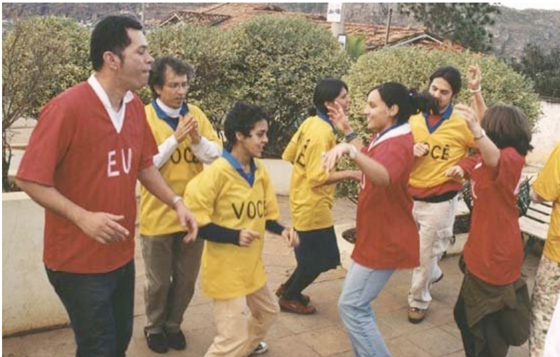
yo-usted , serigrafía, camisetas, juegos, ejercicios. Realizado en Diamantina, Brasil, 2000.

solamente a los que comparten la intensidad de la experiencia, y es refractaria a la documentación; la otra, por el contrario, se construye mediante imágenes y videos producidos durante las acciones. Esas imágenes se conciben y se administran sin el compromiso de representar la realidad de la acción y, por lo tanto, abren espacios para la ficción y la narrativa por medio de la edición en video y el reencuadre fotográfico. La intención es alejarse de la “pura” documentación y jugar con las imágenes de acuerdo con propósitos expositivos que incluyen los principales conceptos del proyecto. Por lo tanto, cada propuesta de juegos y ejercicios yo-usted trae como resultado dos experiencias: una para los participantes y otra para la audiencia. Ambas pretenden ser intensas. La fotografía de abajo que muestra un momento de este proyecto, nos lleva a la primera parada: