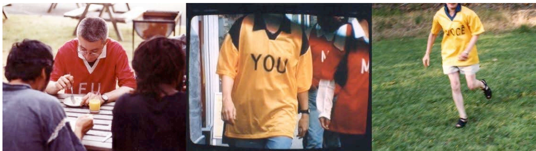
yo-usted , serigrafía, camisetas, juegos, ejercicios. Realizado en el País de Gales, Gran-Bretaña, 1999. (esto es un pie de foto)

Así, los juegos & ejercicios yo-usted se planean para proporcionarnos, tanto a mí como a los participantes, una investigación intensiva sobre los “pronombres en dislocamiento”. En términos de dinámica de grupo, el patrón común nosotros y ellos es re-trabajado y ampliado mediante este proceso.